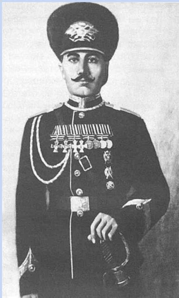
Драгунский старший унтер-офицер Семен Буденный, 1916

Стоит отметить, что первый свой Георгиевский крест Буденный «потерял» за то, что не дал спуску ударившему его по лицу унтер-офицеру, но сумел вновь заслужить награду. Надо сказать, что все свои Георгиевские кресты и медали Семен Буденный получил вполне заслуженно, о чем свидетельствуют сохранившиеся наградные листы. Судя по всему, в хуторском паренке, которого в 1903 году призывали на срочную