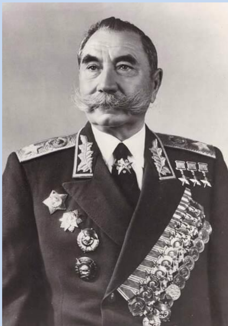
Семен Буденный в парадном мундире, начало 1970-х годов

высокотехнологичной войне нового типа не добился. В 1943 году маршала назначили командующим кавалерией Красной Армии, и он оставался на этой должности до 1953 года. С 1947 года Буденный занимал одновременно и должность заместителя министра сельского хозяйства по коневодству.