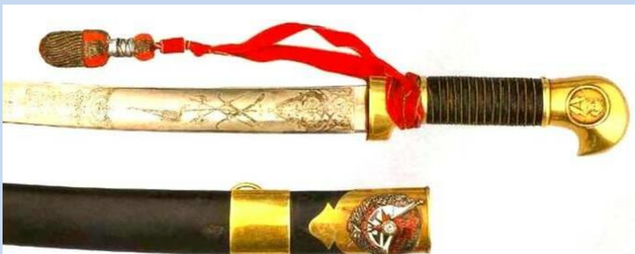
Почетное революционное оружие С. Буденного: шашка с портретом К.Маркса на эфесе и изображением ордена Боевого Красного знамени на оголовье ножен

Еще более уникальным человеком делает Семена Буденного обладание двумя видами почетного революционного оружия — наградной шашки и наградного пистолета. Таких кавалеров в СССР было всего двое: командующий Первой конной армией и главнокомандующий вооруженными силами РСФСР Сергей Каменев. Первым, кому вручили шашку с изображением ордена Красного Знамени, стал как раз Каменев, а Буденный был третьим обладателем подобной награды. А вот пистолеты Маузера К96 они получили одновременно, 5 января 1921 года, и больше подобное оружие никому и никогда не вручалось.