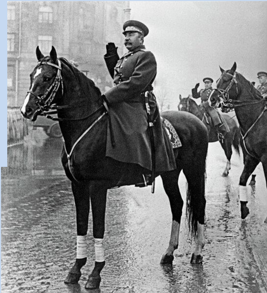
Командующий кавалерией Красной Армии маршал Семен Буденный принимает парад на Красной площади, 7 ноября 1947 года.

Прославившийся в годы Гражданской войны как организатор одной из самых боеспособных частей Красной Армии – Первой конной армии, Семен Буденный в межвоенный период успел окончить Академию имени Фрунзе, получил должность инспектора кавалерии РККА, а потом – заместителя наркома и первого заместителя наркома обороны. В 1941-42 годах маршал Буденный командовал группами войск и фронтами, но, как и многие другие высшие советские военачальники, выдвинувшиеся в первые ряды в годы Гражданской войны, успеха в маневренной