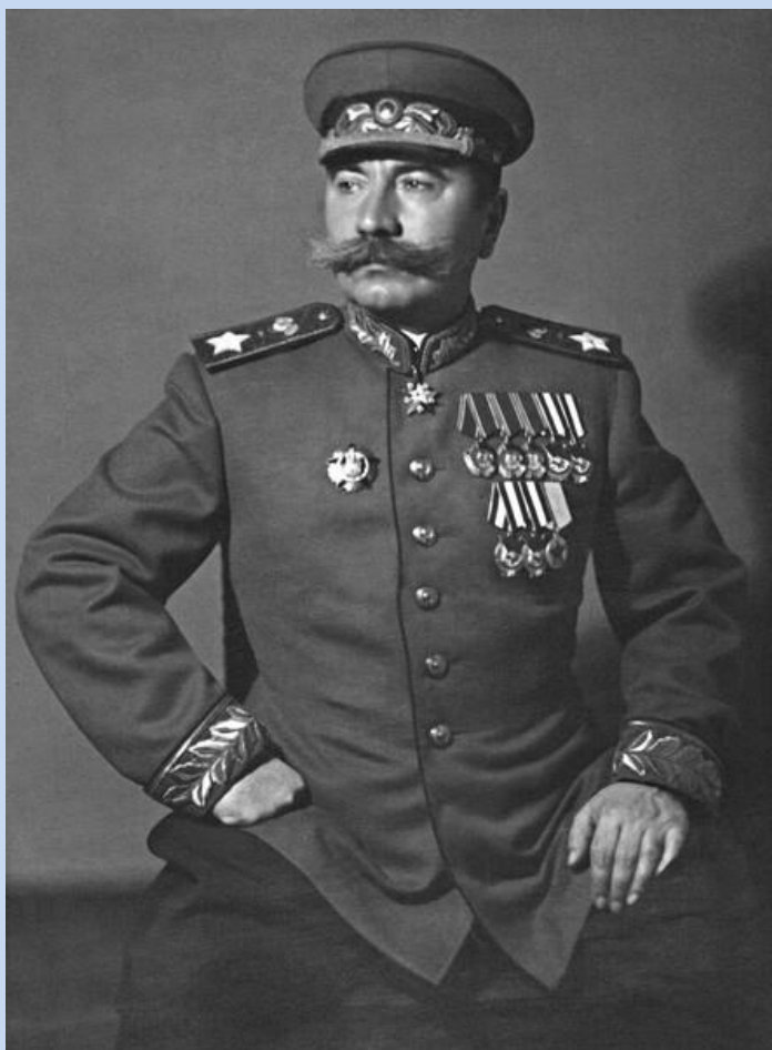
Буденный в маршальском мундире в годы Великой Отечественной войны, 1944

Свой первый орден Красного Знамени командарм Буденный получил в 1919 году, три – в межвоенный период, один – в 1944 году и последний – в 1948 году. К военному времени относится и награждение двумя орденами Ленина (1943 и 1945 годы), тогда как до войны Буденному была вручена всего одна такая награда, а все остальные он получил уже в послевоенные годы.